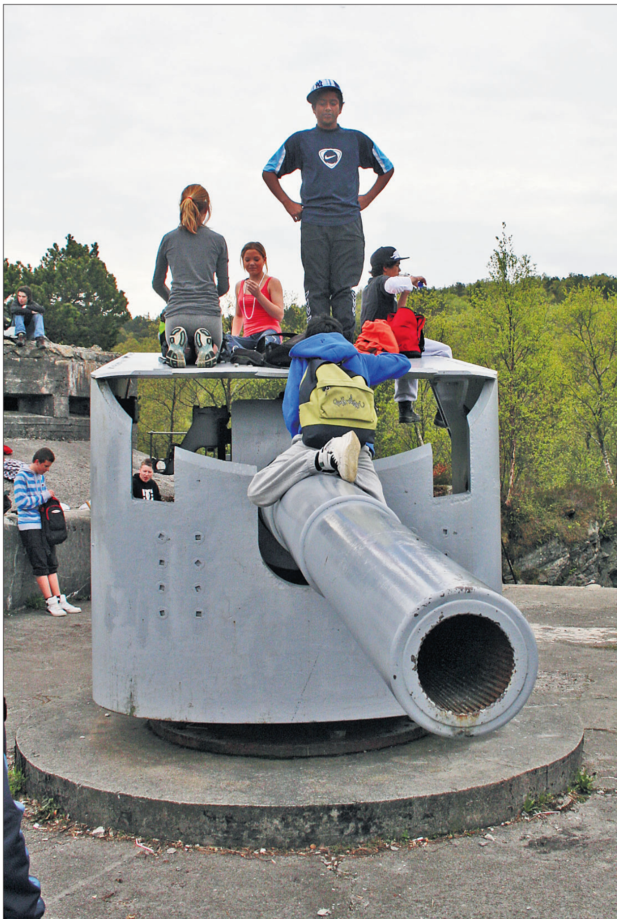
Elevene ved St. Paul skole jobber hvert år dugnad for å holde kulturminnene ved Kvarven fort i god stand.

– Vi kunne håpe at flere skoler tar dette opp i seg for å få elevene engasjerte, sier Zakariassen.