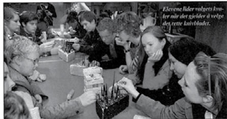
Elevene lider velgjets kniver når det gjelder å velge det rette knivbladet.