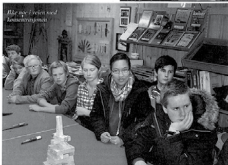
Ikke noe i veien med konsentrasjonen