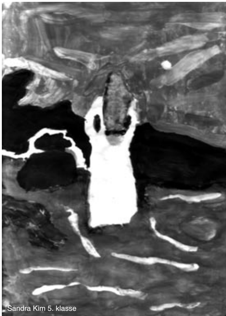
Sandra Kim 5. klasse