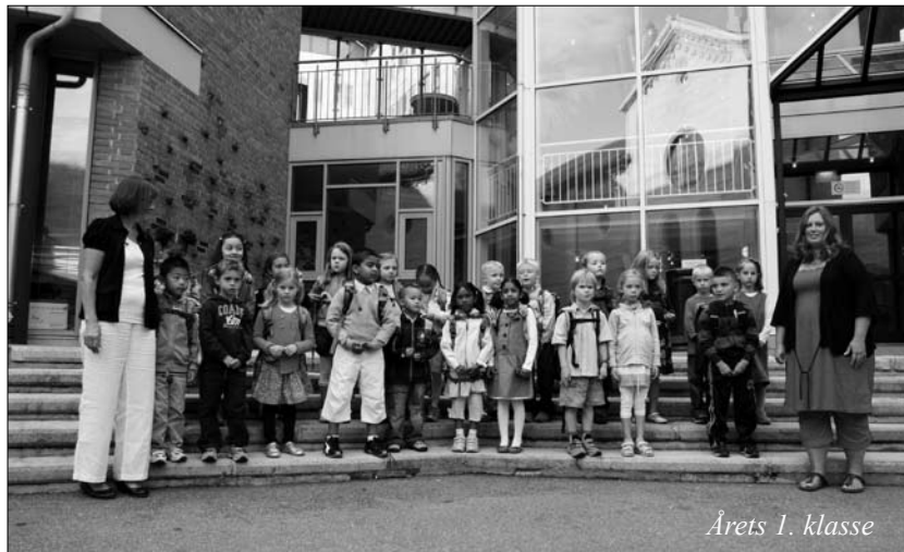
Årets 1. klasse