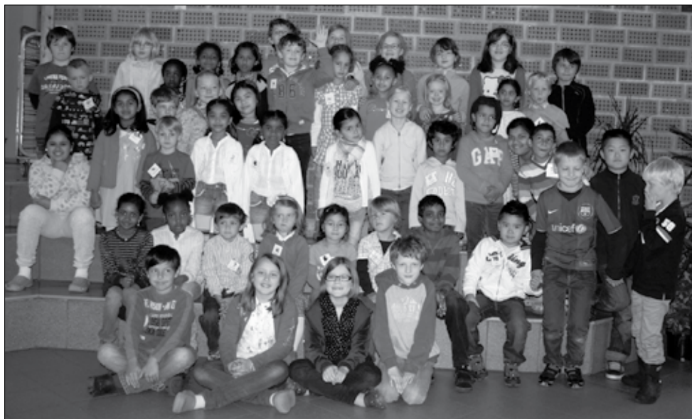
Årets nye førsteklassinger med sine faddere i 5. klasse. Det er godt å ha en hånd å holde i!

Velkommen til nytt skoleår! Til nye og gamle elever, velkommen til kollegiet og skolen. Håper alle har hatt en ok sommer.